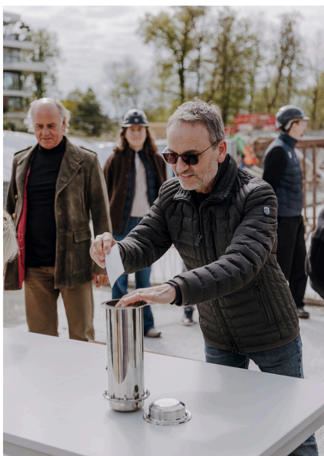
Persönliche Wünsche für die Zukunft des Quartiers: Die Zeitkapsel wird mit handgeschriebenen Botschaften gefüllt.