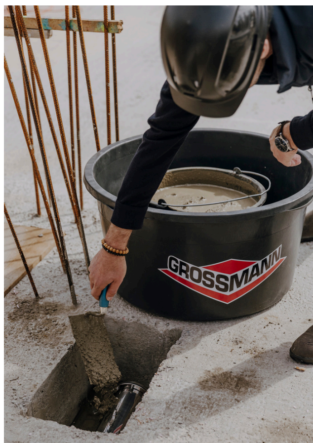
Ein Moment für die Nachwelt: Die Zeitkapsel wird im Fundament verankert.